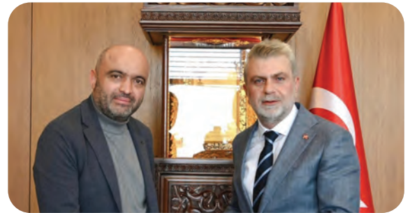
Kahramanmaraş Büyük Şehir Belediye Başkanı Fırat Görgel Ziyareti