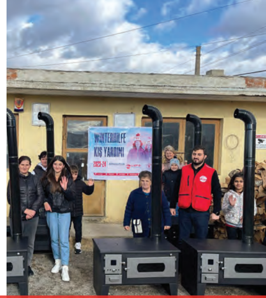
Arnavutluk'ta gerçekleştirilen kış yardımlarına Genç WEFA da katıldı.

Berlin'de gerçekleştirilen Gençlik Buluşması kapsamında, katılımcılara Genç WEFA'nın yürütmekte olduğu insani yardım projeleri hakkında detaylı bilgiler sunuldu.