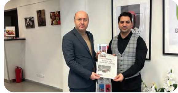
T.C. Viyana Büyükelçiliği Basın ve Turizm Müşavirlerinin WEFA Viyana Şube Ziyareti