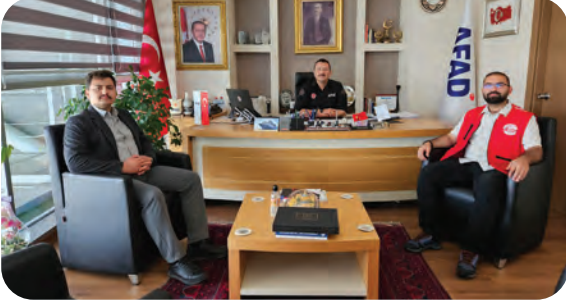
AFAD - Afet Risklerini Azaltma ve Önlem Dairesi Başkanı Abdülkadir Tezcan Ziyareti