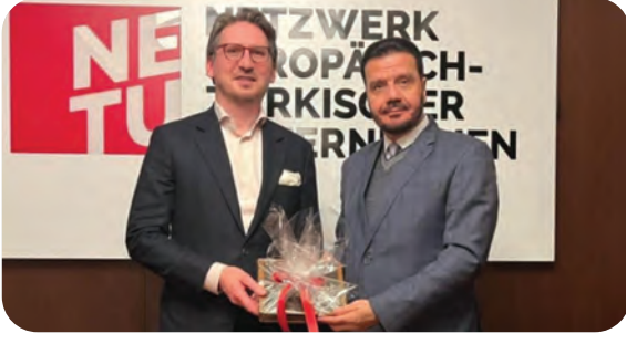
NETU Berlin (Netzwerk Europäisch – Türkischer Unternehmen) Ziyareti