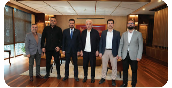
Ümraniye Belediye Başkanı İsmet Yıldırım Ziyareti