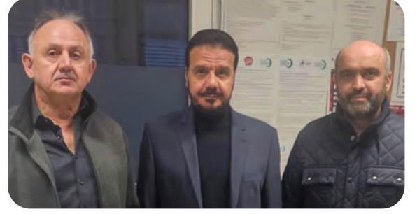
DIKZ (Deutsch Islamische Kulturzentrum) – Alman İslam Kültür Merkezi Ziyareti