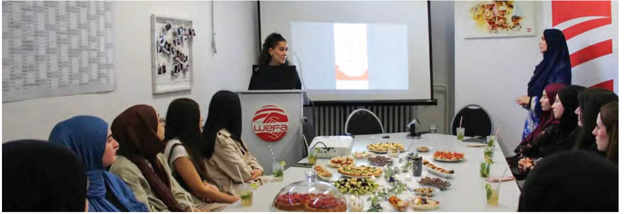
Almanya'nın Köln kentinde Kış Yardımı kapsamında evsizlere yardım paketi dağıtıldı.

Berlin'de gerçekleştirilen Gençlik Buluşması kapsamında, katılımcılara Genç WEFA'nın yürütmekte olduğu insani yardım projeleri hakkında detaylı bilgiler sunuldu.