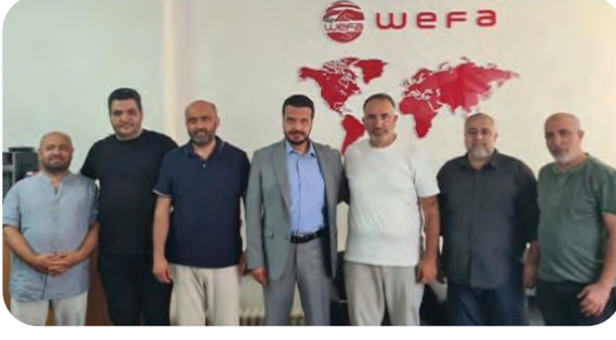
Sevap Tası Derneği Yönetim Kurulu Üyelerinin WEFA Genel Merkez Ziyareti