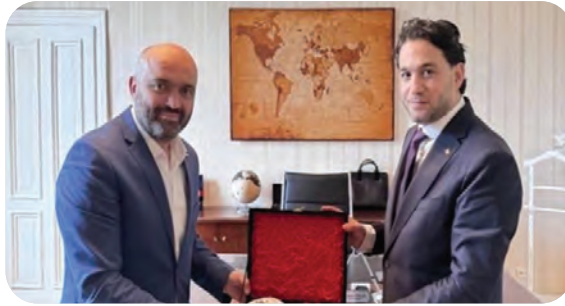
UID - Uluslararası Demokratlar Birliği Genel Başkanı Kenan Aslan Ziyareti